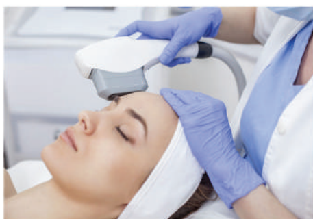
Esempio di Trattamento

HIFU Evo agisce nel derma profondo con conseguente contrazione dello SMAS (Sistema Muscolare aponeurotico superficiale).