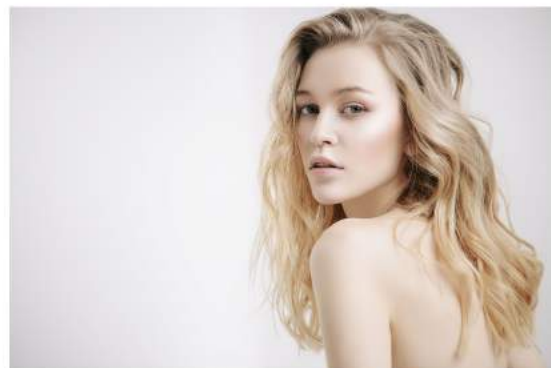
Ringiovanimento del tessuto cutaneo