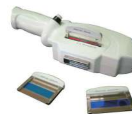
Sei Filtri Intercambiabili

Il trattamento a luce pulsata Elettra Light agisce sui capillari che nutrono i bulbi piliferi, permettendo di trattare anche i peli chiari e bianchi, con ottimi risultati visibili già dopo le prime sedute. Inoltre l'energia luminosa è in grado di incrementare il turn over cellulare, stimolando la produzione di nuovo collagene, che rivitalizza la tessitura e la consistenza della pelle, ricompattando i pori dilatati ed eliminando le discromie cutanee da cromoaging o da fotoaging.