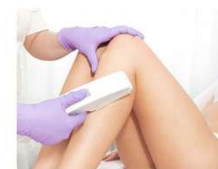
Esempio di Trattamento